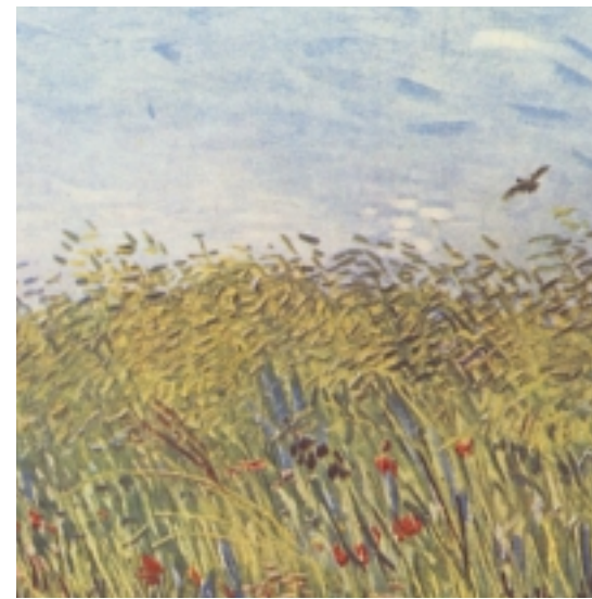
Unter Verwendung von Vincent van Gogh, Getreidefeld mit Mömbäumen und Lerche

Menschen für Menschen. Unterstützen Sie die erfolgreiche Hospizarbeit in Ettlingen mit Ihrem guten Namen.